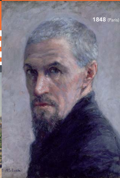
Tableau "Portrait de l'artiste", vers 1889