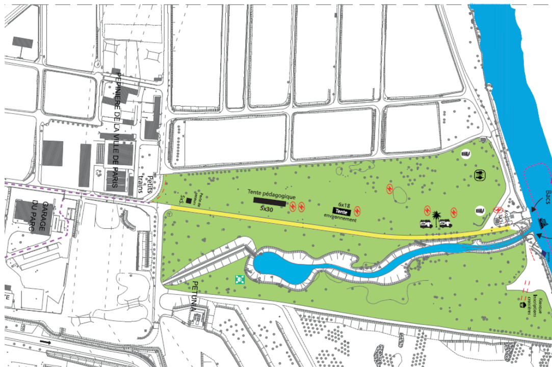
2) Food truck côté Jardin de Paris

➔ Ce plan est à titre d'exemple, Foodtruck côté Champs de lavande et côté Jardin de Paris