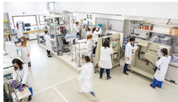
Programme scientifique inneauvation

Pour en savoir plus, www.inneauvation.fr